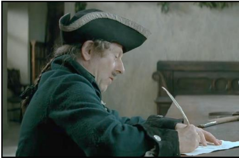
Kadr filmowy nr 1

Obejrzyj poniższe kadry filmowe z ekranizacji Zemsty w reżyserii Andrzeja Wajdy i przeczytaj zamieszczone pod nimi fragmenty utworu Aleksandra Fredry.