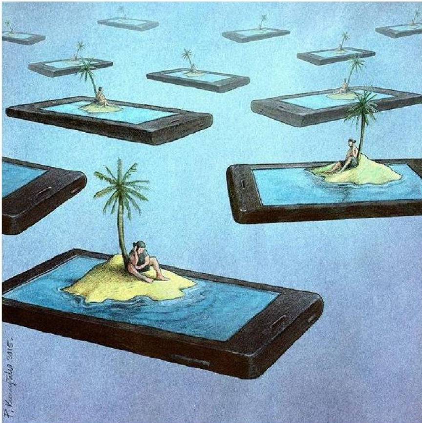
Paweł Kuczyński, Wyspy , www.digitalyouth.pl

Czy grafika Pawła Kuczyńskiego mogłaby być ilustracją do tekstu Pochwała przyjaźni ? Uzasadnij swoją odpowiedź.